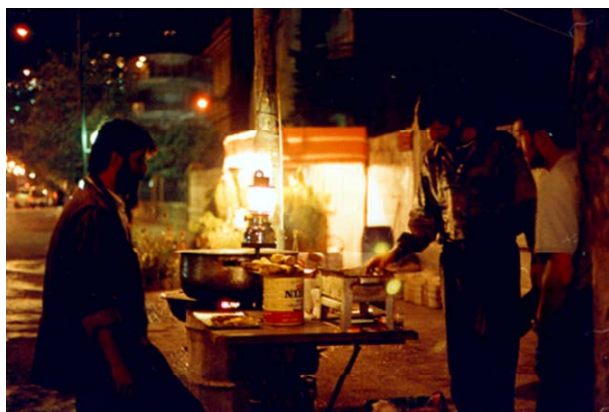
ダマスカスのとうもろこし売り屋台

やはり日本と気候が違うせいかな、草丈はあまり伸びなかったものの、正真正銘の有機栽培無農薬とうもろこし。みんなの、とりわけ子供達の喜ぶ顔を見たさに、今年も去年以上に収穫できるよう頑張ろうと思っている。(在シリア・大沼)