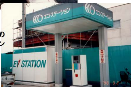
電気自動車用の エコステーション