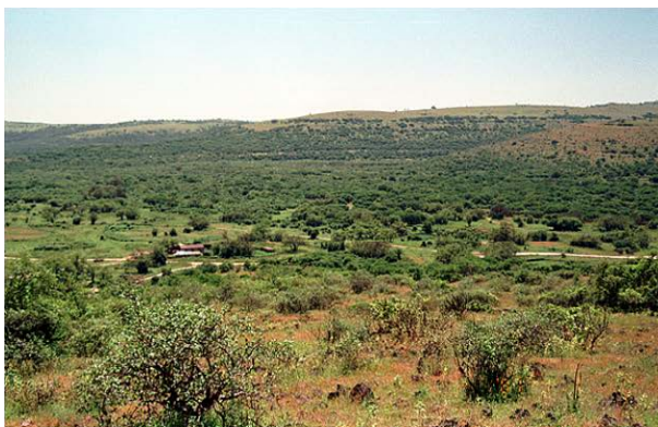
緑に覆われた山岳地域・ジャバル