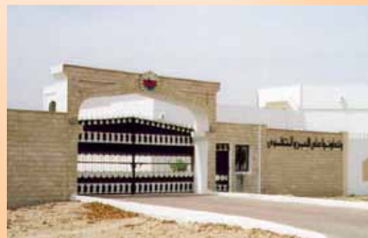
障害者支援センター