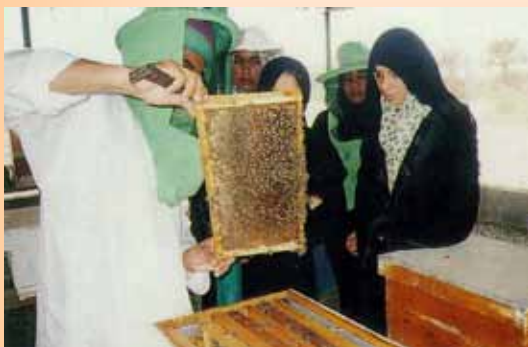
養蜂技術講習（資料から）