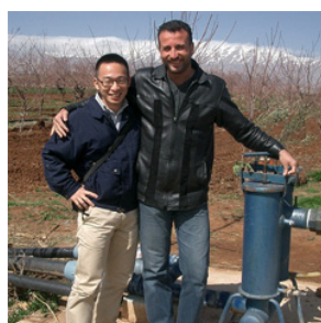
日本人が『接着剤』になる