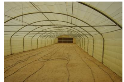
側窓、天窗の無いハウス

一方で中東のハウスは、いかに空気の通りを良くし冷房の効率を上げるか、という事を重視しているのではないかと思う。換気扇で室内の空気を引っ張ることから、乱流の発生を軽減させるために側窓や天窗は付けず、アーチ型をしているのではないだろうか。