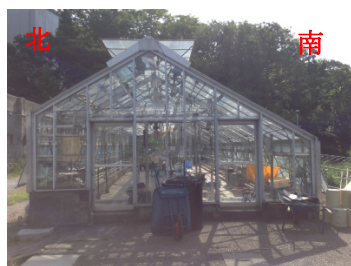
スリークウォータ型ハウス

日本と中東でのハウスの形状の違いは次のように考えられる。日本のハウスは、主に冬に栽培することを想定しており、日