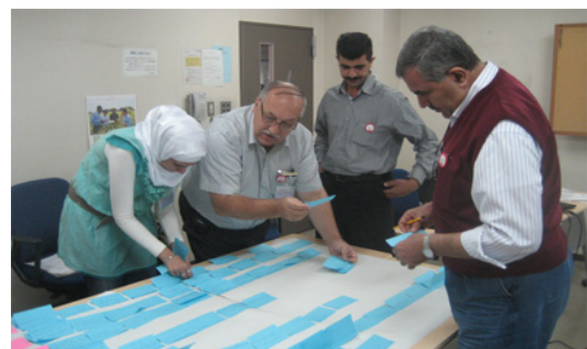
CUDBAS 手法による研修ニーズの検討

さまざまな研修活動は、「個人」としての人材育成や能力強化をめざして行われるのが一般的である。もちろん組織を構成する個人の能力が向上することは重要であるが、組織全体としての能力向上やその機能を高めていくことが、目標達成には不可欠である。