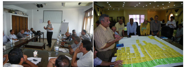
研修実施者向け研修