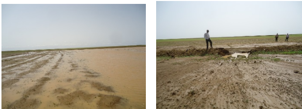
集水したジダアとはげしい水流で一部が破壊された土堤

筆者は、これまでもシリア、パレスチナ、モンゴル において、牧畜民の生業活動をいくつかみてきたが、 彼らの「農耕」のスタイルは非常に簡便なものであった。 いうまでもなく、牧畜民の生業基盤は家畜生産のほう であり、農耕は牧畜を補完する程度にすぎなかったり する。農耕に従事する場合も直接的な農作業であるよ り、委託耕作であったり、不耕起での播種であったりと、 なるべく耕作に手間をかけずに省力する事例が多い。