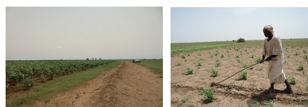
ジダア内で生育したソルガム畑と除草風景

しかし、雨が極端に少ない、もしくは降りかたが かたよる年はせっかくジダアを築いてもソルガムの収 穫は皆無となる。収穫がなければ牧畜民は家畜を売却 し、町に出稼ぎにでるほかはなく、天水農業には脆弱 できびしい現実がどこまでもついてまわるのはまちが いなくである。