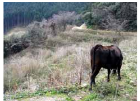
遊休農地で草をはむ繁殖牛

さて、実際の事業がどのように進められるかということ、導入当初は「レンタル制度」で放牧牛を県より借り入れる。放牧したい場所を電気牧柵（購入もしくはレンタル）で囲う。導入牛（繁殖目的）を放牧に適応するように処理（牛が放牧地外に出ないように、電気牧柵に触れさせ、電気を怖がらせ、柵のそばに寄らないようにする。ダニなどの皮膚病対策に体に薬を塗る。）が行われる。日常的には、電気牧柵の管理や牛の健康状態のチェック、飲料水の確保などさえ行えば、夜でも放置できる。このような事業により、農家側も購入飼料を削減、牛舎の管理の簡便化など飼育に要する労働を軽減することが可能となる。また、牛は放牧地で悠々自適であるため、ストレスがかからない。景観の改善にも繋がる。もっと言えば、地域景観の環境整備にも繋がっていくと考えられる。