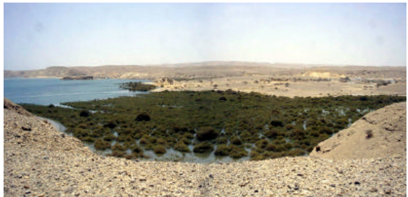
オマーン・スール地区のマングローブ植生

国際耕種とマングローブのつながりには浅からぬものがあり、1980年代初頭にアラブ首長国連邦で水産養殖の専門家によって行われていたマングローブ林造成試験に関わり合ったことが振り出しになっている。さらに、AAI周辺の研究者などと共にMAMAS (Marine Aquaculture and Mangrove Afforestation in Sabkha) を立ち上げ、乾燥地域に分布する塩性湿地での植林に向けた情報・知識の蓄積を図ってきた。このような中、2000年4月か