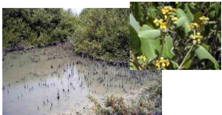
気根の発達とヒルギダマシの花（オマーン・シナス地区）

このシリーズでは、国際耕種とマングローブとの長年の関わりや経験（特にオマーンやアラブ首長国連邦を中心とした湾岸及びその周辺地域）に基づいて、マングローブの持つ歴史的、社会・経済的意義、さらには今日の環境保全や地域開発の観点からマングローブ生態系とどのように関わりを持っていくかについてじっくり考えてみたい。