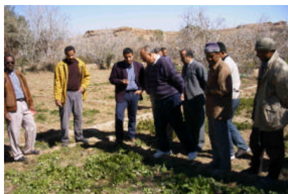
篤農家からの聞き取り（第3国研修、モロッコ）