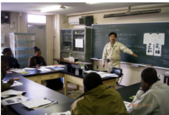
筑波国際センターでの南部アフリカ研修業務風景

国際耕種も「人造り・人材育成」を業務の大きな柱として活動してきた。筑波国際センターにおける研修事業への参加、開発調査での研修計画の作成や実施、派遣専門家による農業普及員研修の企画及び実施や技術交換事業、第3国研修への協力などを実施してきている。このシリーズでは、これまで我々が関係してきた業務の中で経験した「人造り・人材育成」活動を紹介して、その中で体験した喜び、不満、運営上の問題点などを掘り下げるとともに、よりよい研修実施のためにそのあり方や意義を再検討していきたい。