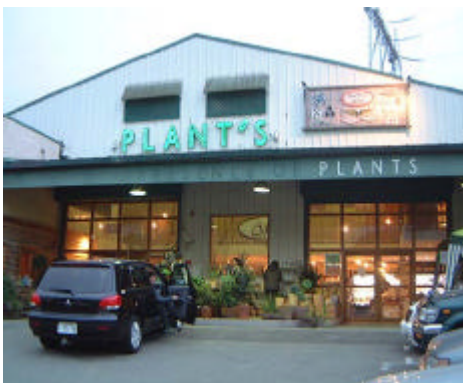
オーガニック製品ショップ「プランツ」

我々が、本当に心豊かな暮らしをしていくためにはどのような生活のスタイルが望ましいかは、グローバルスタンダードを謳う貨幣経済社会を基盤とする米国や日本のみならず、世界の国々での人やモノが密集した殺伐とした都市部や農村が荒廃する姿といった現況を見れば自ずから答えは出ている。これからの農業においても、換金作物を大面積栽培するといった貨幣経済にのせたビジネスと考える単一作物生産大規模機械化農業ではなく、家族皆で米・麦穀類や野菜を作り、家畜を飼うといった自給ベースの小規模家族農業も一つの選択肢ではないか。それは、世界中のそれぞれの国に共通する農的生活のスタイルで、日本でも伝統的農業が行われていた昭和40年代までは当たり前に見ることができた農村の風景であり、それは原風景ともいわれる美しい日本の暮らしの姿であった。農を中心として、林産、水産、そして様々な手わざが加わることによって生活に本当に必要な物を必要なだけ生み出し、お互いに助け合いながら物々交換によってものが循環していく伝統的な暮らしこそ、真に心豊かで健やかで楽しい暮らしの姿ではないだろうか。国際耕種としても、そのようなあるべき暮らしの姿を如何に現代社会と融和を図っていくのかを積極的に検討していきたい。そして、山田の中からこそ再び生き活きとした息吹が芽生えるような社会であるようにと願う。