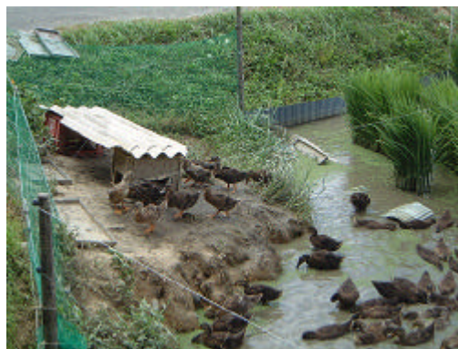
元気に泳ぎ回る合鴨