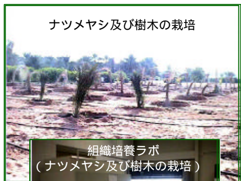
ナツメヤシ及び樹木の栽培

ナツメヤシはサウジのみならず湾岸一帯から北アフリカに及ぶ広大な地域の景観を形作る代表的樹木である。また代表的農産物の一つにもなっている。五千を超える品種があると言われていたが、サウジでは約450品種が栽培されている。分類は主として果実の品質に頼っているのが現状である。一方、カフジはサブハ(塩性湿地)と呼ばれる高塩分環境である。そのため緑化にあたっては耐塩性の高い樹木を選定することが必要である。ここでは組織培養によるマイクロプロパゲーション(幼木の増殖)・遺伝子解析・光合成研究等に用いるナツメヤシの品種・系統の収集、組織培養による優良ナツメヤシ苗木の生産、ナツメヤシの品種同定を行うための遺伝子解析技術の確立、内外からの耐塩性・耐乾性の高い緑化用樹木の収集、ナツメヤシと緑化用樹木の塩害の影響を受けやすい土地に於ける生育状況の検討、光合成との関連から見た耐塩性と耐暑性の機構の検討、そして、大規模実証圃場に供する樹木苗木の生産、以上を目的とする。