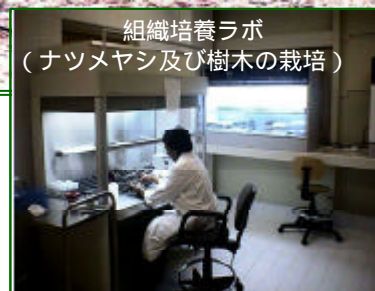
組織培養ラボ (ナツメヤシ及び樹木の栽培)