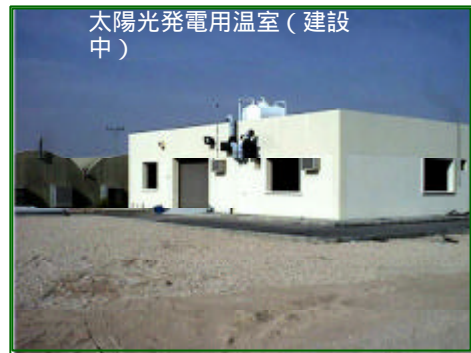
太陽光発電用温室(建設中)

太陽光発電は欧米(米、伊、独、瑞、西等)を中心に技術開発が進んでいるが、サウジアラビアはこれらの国々に次ぐ発電規模を誇っており、かつ砂漠地帯ならではの日射量等太陽光発電に適した条件に恵まれている。ここでは、太陽光発電の独立電源としての市場性の把握、砂漠の苛烈な気候での物理的・電気的耐久性・信頼性の確立、運用方法の最適化(砂埃、シルトの付着・堆積の影響とその対策)、シースルーアモルファス等新しいタイプの太陽電池の信頼性の確認、ビジネス化を前提としたシステムの実用性確立を目指す。プロジェクトでは、養液栽培施設の電源としての実証試験等主としてアプリケーション例の提言を行う。