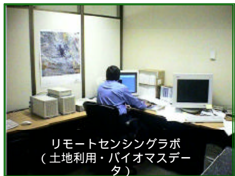
リモートセンシングラボ (土地利用・バイオマスタ)

AAI News では過去リモートセンシング技術をシリーズで取り上げたが、ここでは国土の広大なサウジアラビアで緑被率等砂漠環境の経時変化や植生状況の把握、農業生産量等の解析に利用できるリモートセンシング技術の確立、また都市計画の立案などに有効なGISの技術の実証とその普及を目指す。目標はLandsat、SPOT、JERS-1等の人工衛星からのデータを処理し、植生の季節変化、その面積、農産物の生育状況などを判読する技術を確立することと、カフジ及び北東部地域などの数カ所を対象として、植生、土壌、地質、地形、及び道路、建物、下水道等の地理情報をデータベース化し、都市計画、土地利用計画作成におけるGISの有用性を実証することにある。