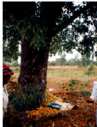
在来種の果樹 - 果肉から酒を造ったり、種子からナッツを採る