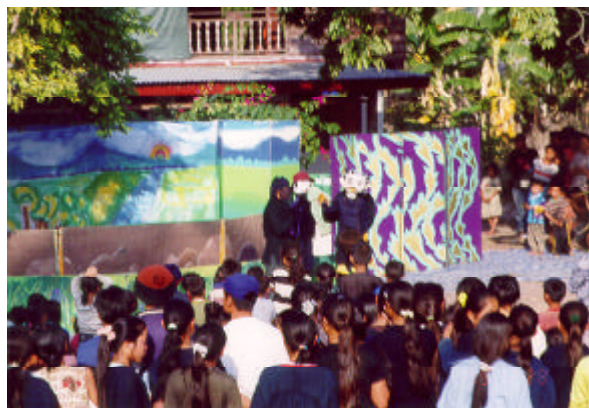
お話キャラバン隊による人形劇