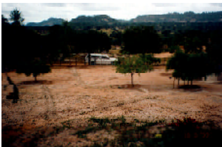
Homestead Development の様子 - 集水のためエッジを切り、スイカなどを植えて

実際の活動として、全国に 10 数 のプロジェクトサイトをもち、農民の交換や視察、ソーラークッカーの普及や Homestead Development (各戸の敷地内での生活向上・保健衛生改善をねらいとして、雨水の集水やキッチンガーデン、小家畜の飼育等を行う) を行うとともに、各サイトのグループメンバーが活動(養蜂、手工芸、製陶、畜産、植林、クッキングオイルの生産、稲作、有機農法の実践、等々)をするために活動センターの建設や資機材の供与及び技術支援を行うが、基本的にメンバーの活動の自主性を重んじている。