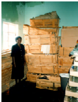
養蜂箱 - 蜂蜜を絞り、市場へ出荷する