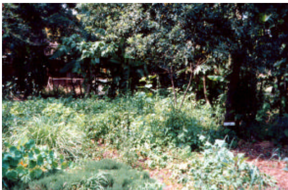
パーマカルチャーの畑

また PELUM は、東部・南部アフリカ 10 ヶ国に支部があり、住民参加型の持続的資源管理を目的として 1992 年に設立されたネットワーク型 NGO である。いくつかの NGO がメンバーとして参加しており、それぞれ地域 (Community) に根ざした持続可能な農業や村落開発の実施をめざしている。PELUM は、ワークショップの開催やトレーニング実施に重点を置いていて、最近ジンバブエ大学に「PELUM College」という「持続可能な農業」に関する 2 年間の長期コースを開設した。これは講師陣が大学関係者だけでなく、NGO や農業省 (AGRITEX) から参加するというユニークなものである。