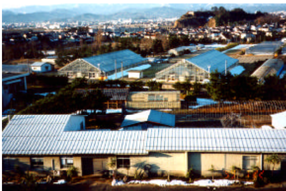
乾燥地研究センター 実験圃場