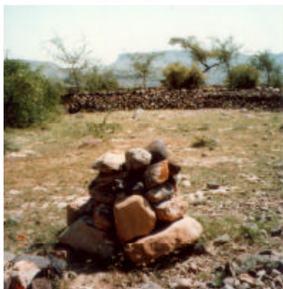
土壌保全用の石積みと 苗木保護用の石積み

パキスタンのほぼ中央に位置する D.G.Khan の西方にあるミタワンヒルトレント流域では、住民参加による流域保全のパイロットプロジェクトが進められている。ここでは留土と流出コントロールを目的としたガリ上流部での石積みチェックダムの建設や、斜面における等高線盛土や三日月型盛土等の小構造物の建設に加えて植林や植生改善などの活動が実施されている。プロジェクト事務所に併設された育苗圃場では、植林用の苗木だけでなく飼料用の灌木や果樹の苗木も生産・配布されている。このようにして流域斜面に水と土を貯留すると共に流域植生の再生を図ることは、流域全体としての牧養力を高めることになり、住民の生活及び生産環境の改善につながる。このように、流域保全は地域住民の生活改善に密接に関連するため、活動には地域住民の参加が不可欠である。そのため、農民組織の育成ならびにグループ・プロモーターによる活動の支援等の住民に対する啓蒙・普及活動もプロジェクトの重要な構成要素となっている。こうした支援活動も当初は試行錯誤の連続であったが、綿花栽培やローテーションによる牧草地管理を取り入れる住民も増えており、最近では村人が率先して新しい活動に取り組むようになってきている。このような動きが流域全体に浸透するようになれば、プロジェクトの効果は計り知れないものとなる。