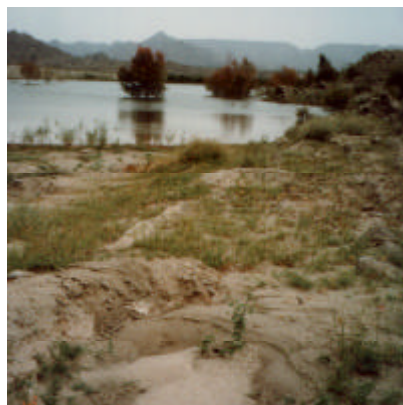
チェックダムによる雨水の貯留と 三日月型盛土による植林