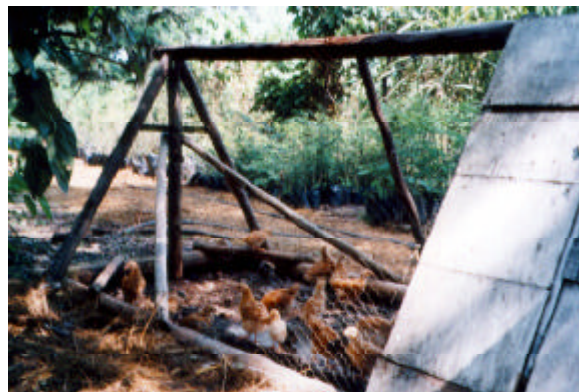
チキントラクター (鶏による「除草、施肥」)