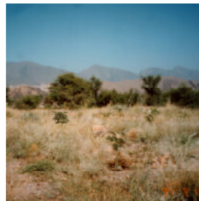
石積みフェンス内で 活着した苗木

このように、ヒルトレント流域における洪水の制御と利用の技術を向上させ、流域の持続的な資源管理へとつなげて行く方法を確立することは、中央アジア、中近東、中国西部などに広く分布する乾燥地域における流域管理や農業生産の方法の改善だけでなく、地域住民の生活改善に多大なる貢献をもたらすものと考えられる。